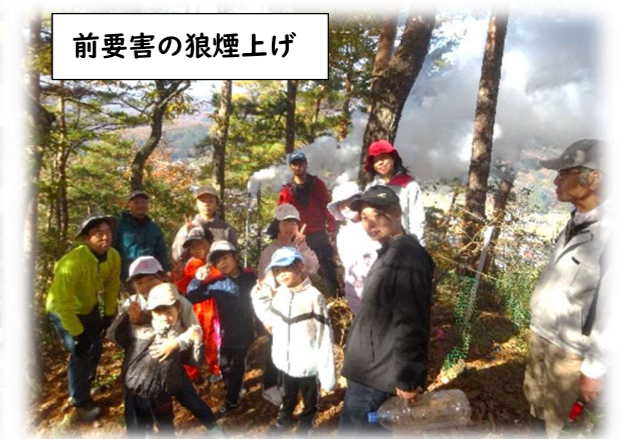
前要害の狼煙上げ