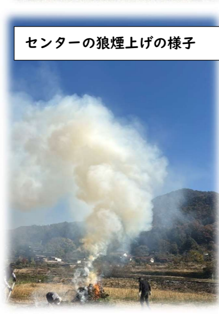
センターの狼煙上げの様子