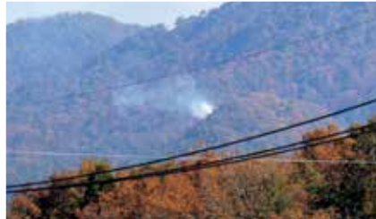
高自治振興区 (後要害山) 点火確認