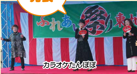
カラオケたんぼぼ