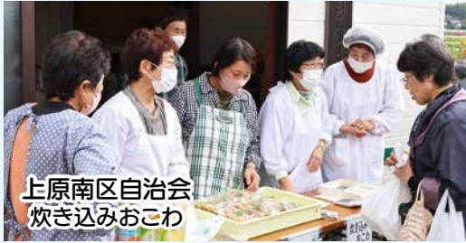
上原南区自治会 炊き込みおこわ