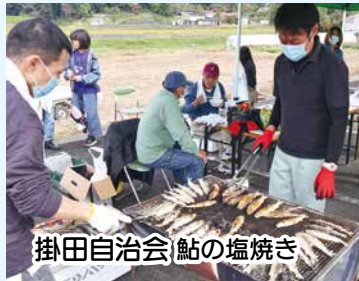
掛田自治会 鮎の塩焼き