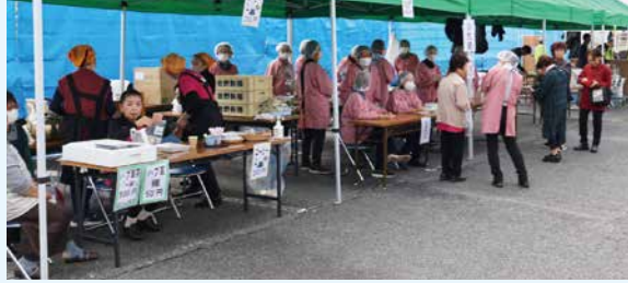
うどん、焼きそば、玉子つかみ、本の譲渡会、ゲームコーナーもにぎわいました