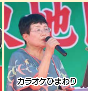
カラオケひまわり