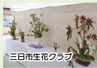
三日市生花クラブ