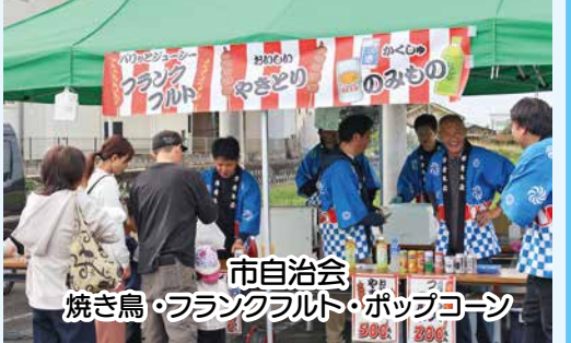
市自治会 焼き鳥・フランクフルト・ポップコーン