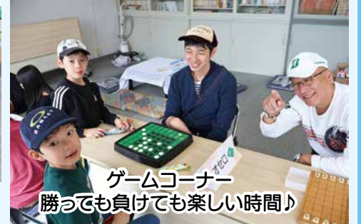
ゲームコーナー 勝っても負けても楽しい時間♪