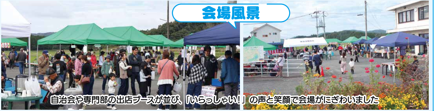
自治会や専門部の出店ブースが並び、「いらっしゃい！」の声と笑顔で会場がにぎわいました