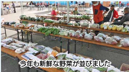
今年も新鮮な野菜が並びました