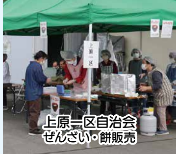
上原一區自治会 せんざい・餅販売