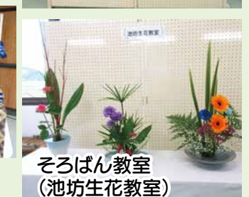
そろばん教室 (池坊生花教室)