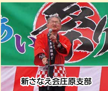
新さなえ会庄原支部