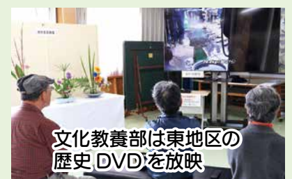
文化教養部は東地区の 歴史DVDを放映