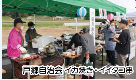
戸郷自治会 イカ焼き・イダコ串