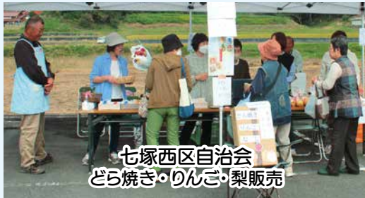
七塚西区自治会 どら焼き・りんご・梨販売