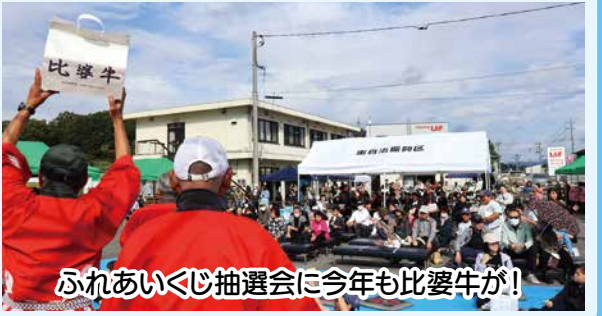
ふれあいくじ抽選会に今年も比婆牛が！