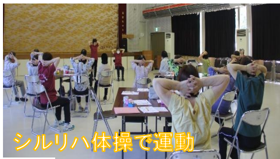
シルリハ体操で運動