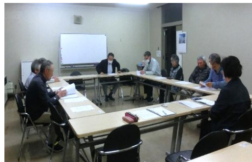
高齢者福祉部会(第1回) 5/30