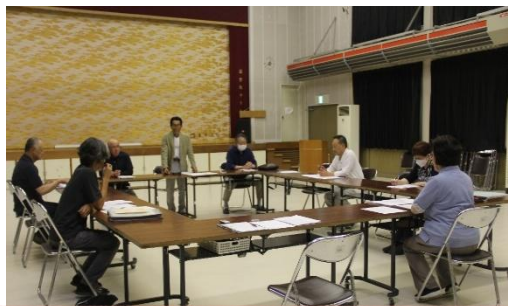
自治会長会議(第1回) 6/19