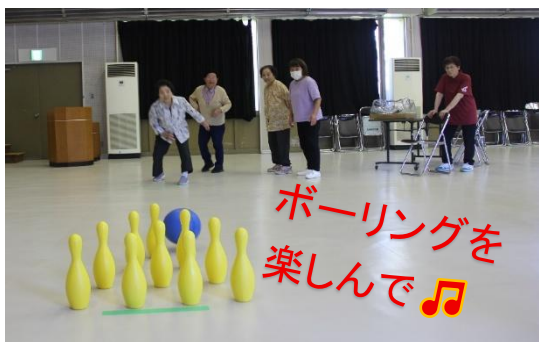
ボーリングを 楽しんで♪