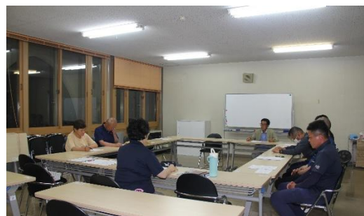
自治会運営部部会(第1回) 6/25