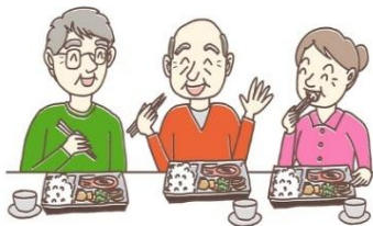
皆でわいわい ランチタイム!