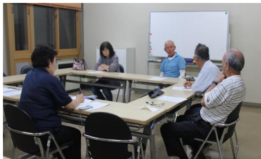
生涯学習部部会(第1回) 6/23