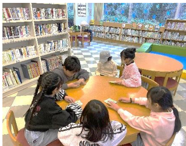
↑ ビンゴゲームをしています なかなかそろいません

ビンゴゲームをしてプレゼントをもらう順番を決めました。もらったプレゼントはみんなで交換しました。