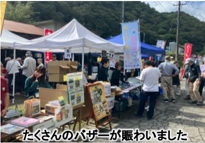
たくさんのバザーが賑わいました