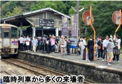
臨時列車から多くの來場者

1,000人を超える多くの人が備後落合駅に來られイベントを楽しみました。子ども駅長が來場者をお迎えし、転車台や給炭台跡の見学、ミニSL乗車体験、歌声ひろばは鉄道唱歌の合唱、鉄道クイズに神楽大黒様の餅まきなど盛り沢山のイベントでした。備後落合駅名物おでんうどんは長い行列ができ、瞬く間に売り切れる人気でした。90周年記念イベントが芸備線・木次線を元気にしました。100周年を迎えることを信じ、芸備線・木次線を守る取り組みを続ける力にもなりました。