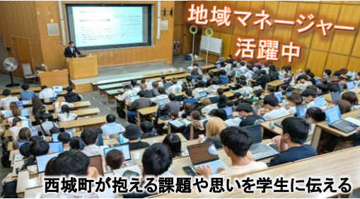
西城町が抱える課題や思いを学生に伝える

県大学生約60人がJR芸備線を利用し西城自治振興センターにやってきました。「中山間地の資源と暮らし」をテーマに清水地域マネージャーが授業内容を計画しました。間伐材を利用して薪を作る「西城木の駅」の活動を紹介し、薪を作る作業は危険で乾燥に1年かかること、今も風呂焚きやストーブに薪を使用していることを伝えました。途中から西城紫水高校生も加わり、薪クイズ、スウェーデントーチへの火付け、西城のさらなる資源の活用方法とPR方法についてのディスカッションを行いました。自然豊かな西城町の観光資源について、意見交換ができました。