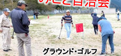
グラウンド・ゴルフ