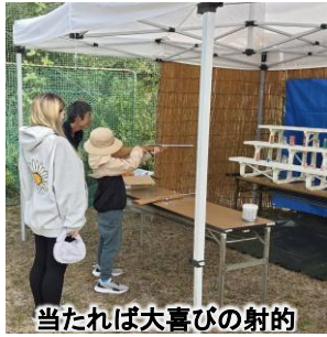
当たれば大喜びの射的

ルック体験などのブースも設けられました。子どもたちはもちろん、大人も一緒になって挑戦し、地域ならではのふれあいの場となりました。普段あまり顔を合わせる機会の少ない住民同士が会話を交わすなど、笑顔と笑い声があふれるひとときとなりました。