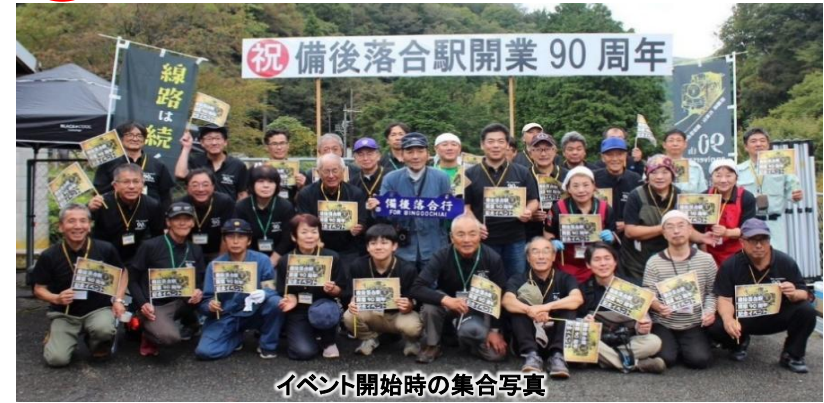
イベント開始時の集合写真