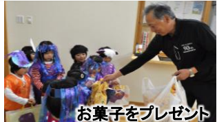
お菓子をプレゼント