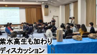
紫水高生も加わり ディスカッション