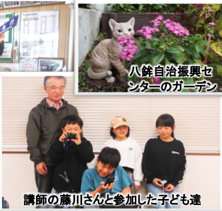
八銚自治振興センターのガーデン