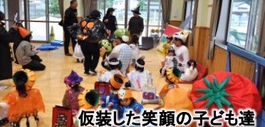
仮装した笑顔の子ども達