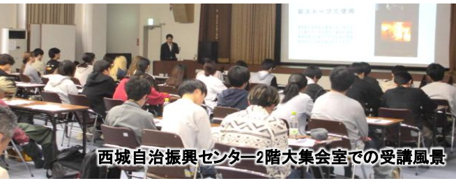
西城自治振興センター2階大集会室での受講風景

県大学生約60人がJR芸備線を利用し西城自治振興センターにやってきました。「中山間地の資源と暮らし」をテーマに清水地域マネージャーが授業内容を計画しました。間伐材を利用して薪を作る「西城木の駅」の活動を紹介し、薪を作る作業は危険で乾燥に1年かかること、今も風呂焚きやストーブに薪を使用していることを伝えました。途中から西城紫水高校生も加わり、薪クイズ、スウェーデントーチへの火付け、西城のさらなる資源の活用方法とPR方法についてのディスカッションを行いました。自然豊かな西城町の観光資源について、意見交換ができました。