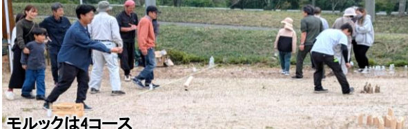
モルックは4コース