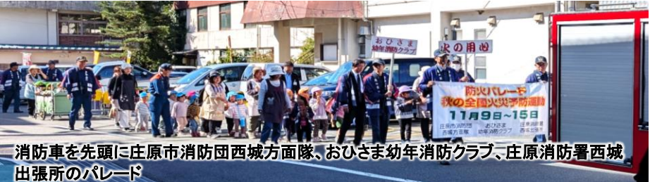
消防車を先頭に庄原市消防団西城方面隊、おひさま幼年消防クラブ、庄原消防署西城出張所のパレード

秋の全国火災予防運動(11月9日～15日)にむけて防災パレードが行われました。空気が乾燥し火災が起きやすい時期です。子ども達が火の用心を呼びかけ町内を歩きました。