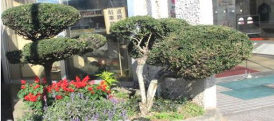
有志の方に花を植えていただきました