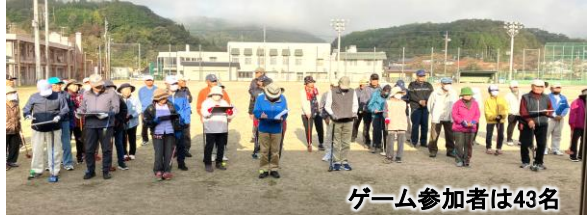
ゲーム参加者は43名

秋の全国火災予防運動(11月9日～15日)にむけて防災パレードが行われました。空気が乾燥し火災が起きやすい時期です。子ども達が火の用心を呼びかけ町内を歩きました。