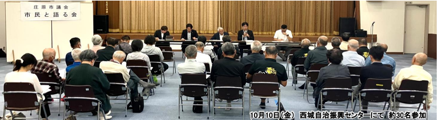
10月10日(金) 西城自治振興センターにて 約30名参加