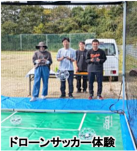
ドローンサッカー体験

みこと自治会では、令和7年10月19日(日)に、西城中学校グラウンドで「グラウンド・ゴルフ大会」と「みこと縁日」を開催しました。前日まで天候が心配されましたが、当日は穏やかな秋晴れとなり、地域住民35名が参加して、和やかな雰囲気の中で行われました。グラウンド・ゴルフ大会では、長年親しまれてきたスポーツを通して、世代を超えた交流が生まれました。参加者たちは笑顔でプレーを楽しみながらも真剣な表情を見せ、ホールインワンが出るたびに大きな歓声と拍手が起こるなど、グラウンドは終始活気にあふれていました。また、同会場では「みこと縁日」として、射的やドローンサッカー、モ