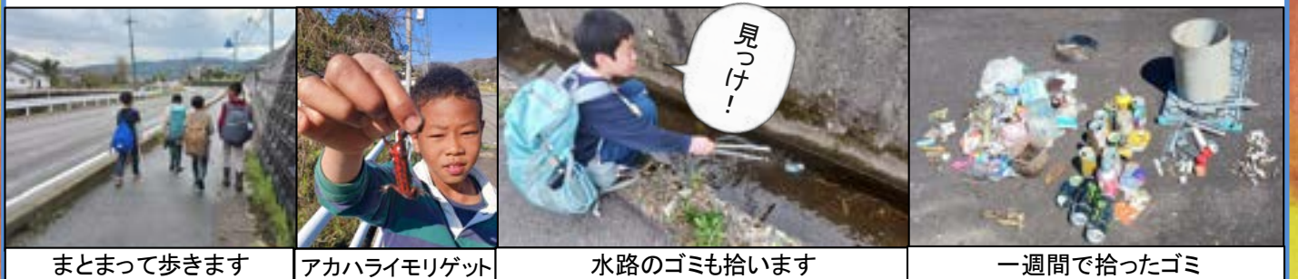
まとまって歩きます

4月から、夢小の高学年数名が放課後に北自治振興センターまで歩いて下校しています。17時に保護者がセンターに迎えに来るまでの間、生き物探しやゴミ拾いをしながら過ごしています。この一年間、車送迎での登下校がほとんどだった子供達。大好きな北地区を友達と歩くという経験がよほど新鮮なようで、みんな本当に楽しそうに歩いています。