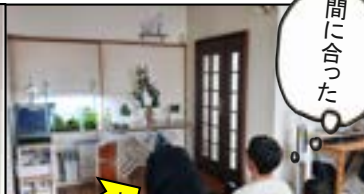
当日朝、長男が電動ドリルで設置