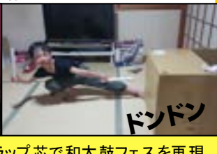
帰宅後ダンボールとラップ芯で和太鼓フェスを再現