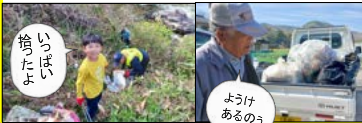
いっぱい拾ったよ

河川清掃に初めて参加しましたが、比和川沿いの道路やガードレール下に山ほどゴミが落ちていました。時間内に拾いきれない程大量にありました。一緒に参加した長男も「なんでゴミを持ち帰らんのかね?」「なんでここに捨てて平気なんかね?」と不思議に思ったようです。次の河川清掃も参加したいと思います！