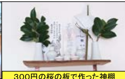
300円の桜の板で作った神棚