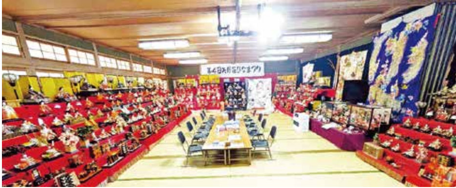
「矢野荘ひなまつり」

次回は、4月11日(土)に国営備北丘陵公園を歩き、総会を開催しますので誘い合わせてご参加ください。