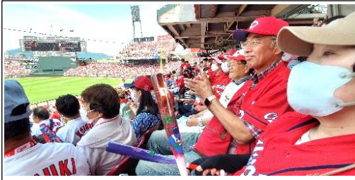
昨年は内野席から激を送りました

昨年はAクラス復活・リーグ2位でシーズンを締めくくったカープ。今年は若手の活躍も光り、手に汗握る楽しい試合を繰り広げています。