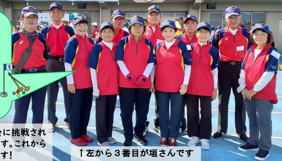
↑ 左から3番目が垣さんです

自治振興区では、これからも全国大会に挑戦される皆さんをあたたく応援してまいります。これからのご活躍も、みんなで楽しみにしています！